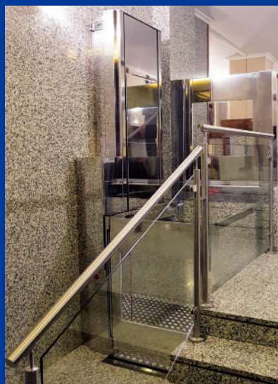
Versión Acero inoxidable pulido